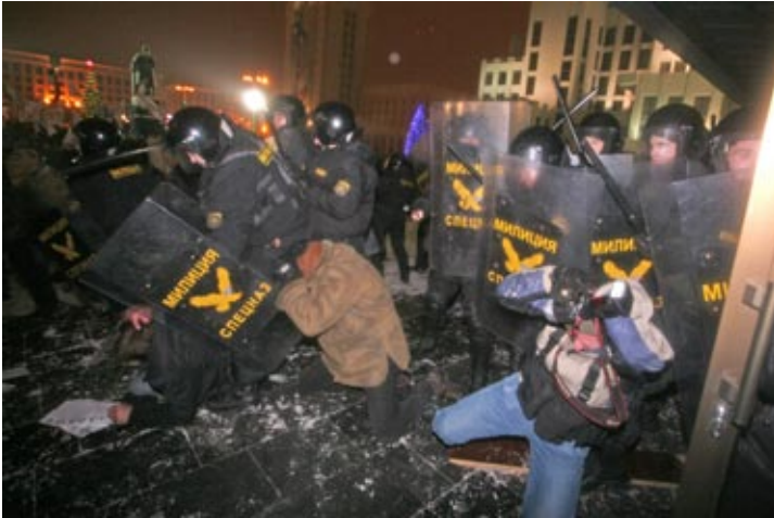
Журналисты под ударами дубинок 19 декабря 2010 г.

19 декабря 2010 г. многие журналисты находились на площади для подготовки материалов для своих изданий. В момент массовых избирательных действий ОМОНа, 27 журналистов были арестованы с применением грубой силы. Причем, ни заметный знак “Пресса” на одежде журналистов, ни их рабочие удостоверения не оказывали никакого эффекта. В ряде случаев, отличительные знаки работников прессы были сорваны или даже разорваны сотрудниками ОМОНа, непосредственно перед задержанием.