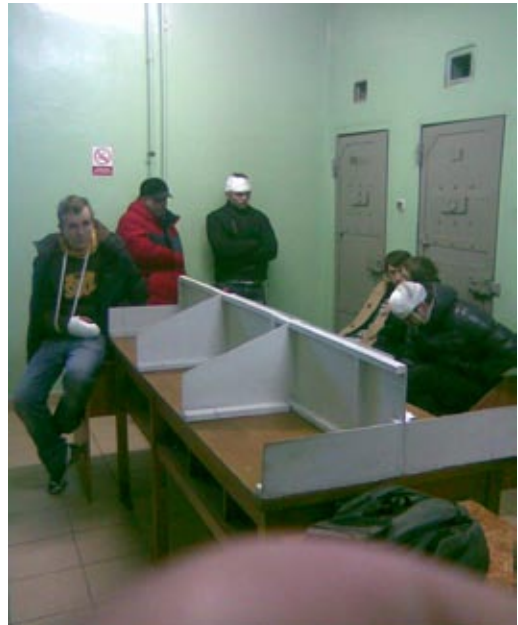
В ИВС на улице