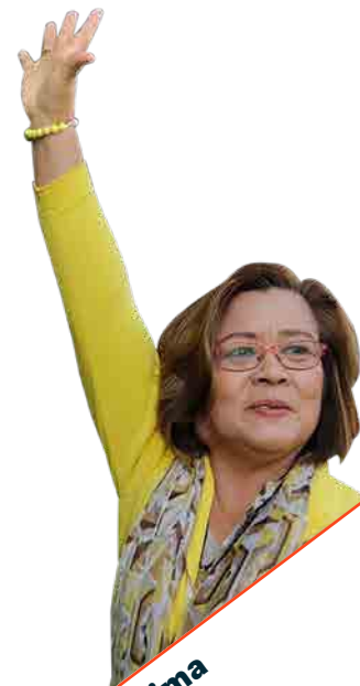
Leila de Lima