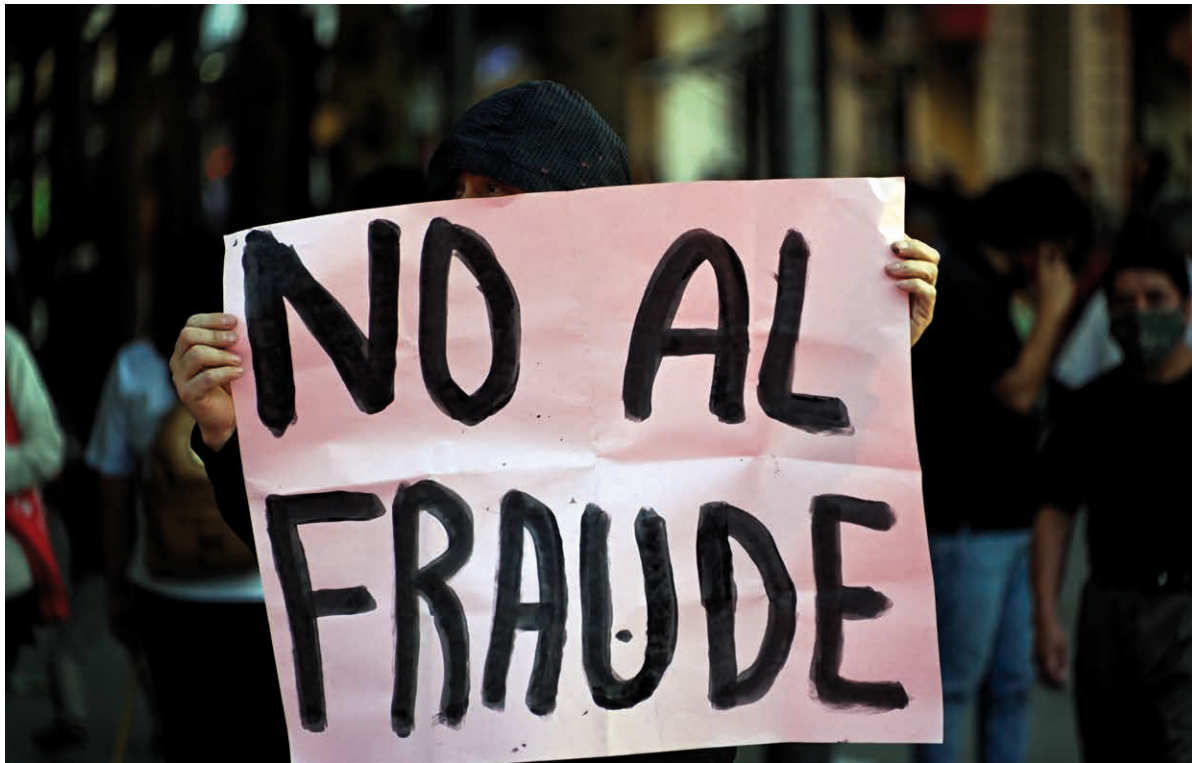
Miembros del Frente de Resistencia contra el Fraude Electoral y la Dictadura participan en una protesta contra la candidatura presidencial de Zury Ríos, la hija del fallecido dictador guatemalteco (1982-1983) Efraín Ríos Montt, para las próximas elecciones, en Ciudad de Guatemala, el 23 de marzo de 2023. Guatemala celebrará elecciones presidenciales el próximo 25 de junio de 2023.