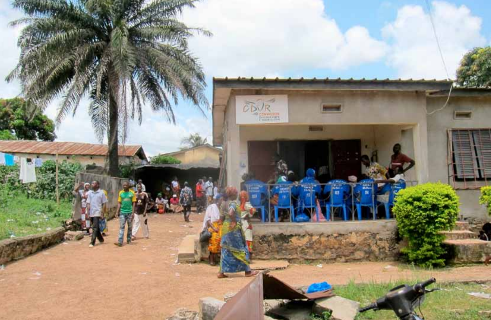
À Duékoué, la commission locale poursuit ses travaux en octobre 2010, après l'annonce de la fin du processus par la président de la CDVR.

Ainsi, 80 victimes ont été entendues à Abidjan au mois de septembre 2014 au cours d'audiences publiques, sans que les critères de sélection n'aient été définis ou expliqués. Les auditions ont de plus eu lieu dans une salle de taille très restreinte, ne contenant que 70 places assises, dans un club sportif de luxe d'Abidjan difficile d'accès, ne facilitant pas la publicité des récits. D'autant que la retransmission à la télévision des audiences, un temps annoncée, n'a finalement pas eu lieu et semble aujourd'hui compromise, rendant de fait ces audiences confidentielles et inaccessibles à la population ivoirienne. De plus, le déroulement des audiences a mis en exergue l'insuffisance de soutien psychologique mis en œuvre pour accompagner les victimes en amont et au cours de leurs auditions publiques.