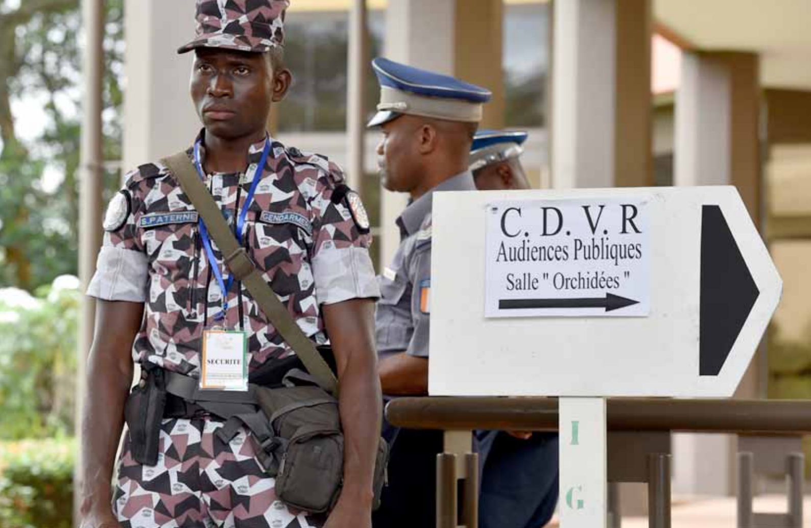
Des gendarmes montent la garde à l'entrée de la salle d'audience de la Commission Dialogue Vérité et Réconciliation à Abidjan, le 8 septembre 2014.

En effet, si des indemnisations correctement attribuées pourraient certainement améliorer la situation matérielle, médicale ou sociale de nombreuses victimes, elles ne pourront ni ne devront suppléer le rôle de la justice ivoirienne, qui, seule, peut apporter une réponse satisfaisante aux attentes des victimes, en qualifiant les crimes commis, en jugeant leurs auteurs, en évaluant les préjudice et en fixant des réparations.