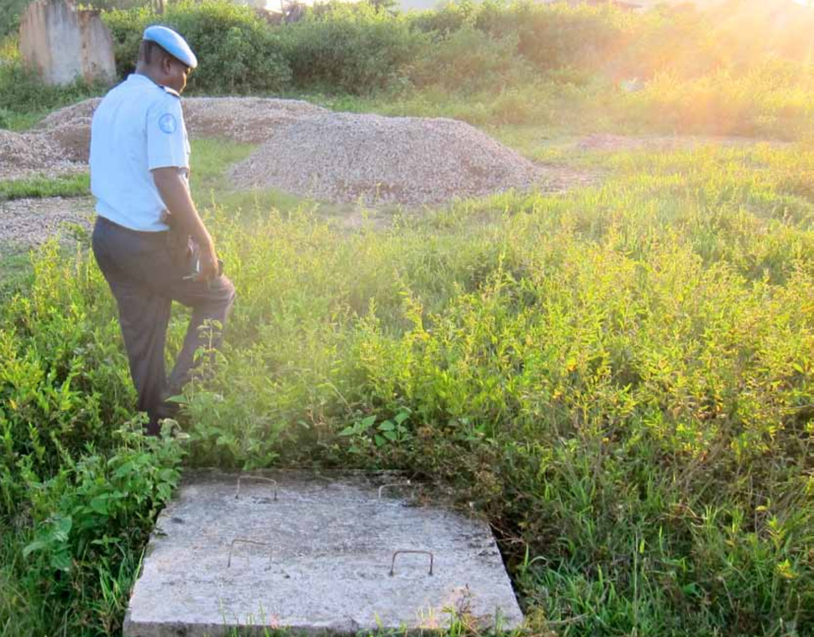
L'un des puits de Togueï, sous garde de l'ONUCI, en attente d'exhumation.

Pas un acte n'a été posé dans ces instructions depuis le mois de juin 2013, soit depuis près d'un an et demi. De même les résultats de l'autopsie des 6 corps découverts dans le puits de Togueï ne sont toujours pas parvenus aux magistrats, pas plus que les corps n'ont été restitués aux familles.