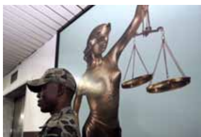
Un garde pénitentiaire monte la garde lors d'une conférence de presse de la Procureure de la Cour pénale internationale à Abidjan, le 19 juillet 2013.