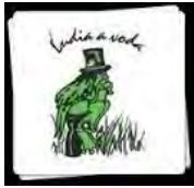
Michal Kravčík, People and Water Slovakia