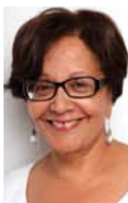
Souhayr Belhassen Presidenta de la FIDH

“Una sociedad auténtica, en la que la discusión y el debate constituyan una técnica esencial, es una sociedad llena de riesgos” 1 . Estas palabras del historiador Moses I. Finley sintetizan perfectamente el espíritu de este duodécimo Informe Anual del Observatorio. El informe documenta de manera precisa la situación de los defensores de derechos humanos en el mundo durante el 2009 y, con ello, pone claramente de manifiesto la dificultad y el peligro que entraña, en el mundo, promover el debate de ideas, el pluralismo, la protección de las libertades fundamentales y el ideal democrático.