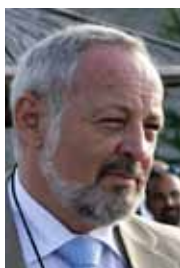
Eric Sottas Secretario General de la OMCT

Una consigna de una simplicidad infantil que numerosos Estados siguieron aplicando al pie de la letra este año