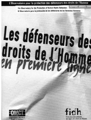
Rapport de l'Observatoire pour la protection des défenseurs des droits de l'Homme, programme conjoint de la FIDH et de l'OMCT. 240p. 80FF (12,20 Euros)

>> La publication du rapport annuel 2000 de l'Observatoire intervient un an après la création par les Nations unies d'un mécanisme international de protection des défenseurs des droits de l'Homme. Hina Jilani, avocate pakistanaise et éminente militante, a été désignée à cette fin, Représentante spéciale du Secrétaire général de l'ONU. Notre combat n'a pas été vain : la création de ce mécanisme constitue une victoire importante pour toutes les personnes qui au quotidien luttent en faveur des droits et libertés fondamentales pour tous, et qui pour cette raison sont victimes de répression.