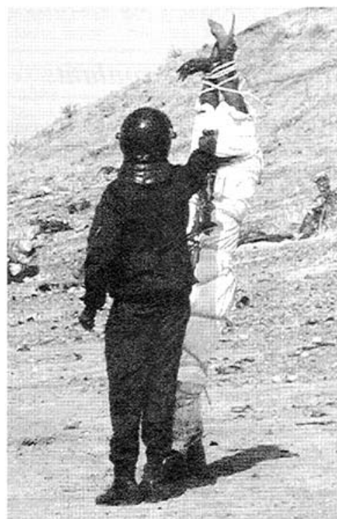
Après l'exécution, le coup de grâce