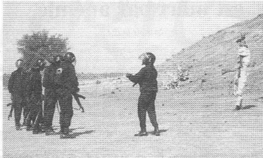
Après l'exécution, la vérification des balles dans les chargeurs

«Dans ces conditions, sa condamnation est exécutoire. La loi est dure, mais c'est la loi. Le peuple tchadien l'a voulu ainsi pour que la