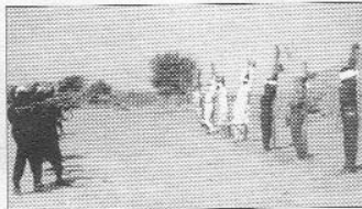
Neuf condamnés à la peine capitale exécutés en deux jours à N'Djaména et à Abeché

Les individus à l'origine d'actes de banditisme sont assoiffés d'argent. Ils visent les quartiers où vivent des hommes d'affaires (Rue de 40 m, quartier Diguel dit Colombie, etc.) et le quartier rési-