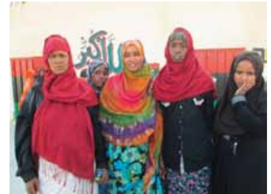
مخيم الطويشة في طرابلس

في وقت الزيارة كانت هناك نحو ٦٠ سيدة صومالية متجمعات في زنزانة مجاورة. كن قد خططن للهجرة إلى أوروبا بعد الوصول إلى ليبيا بنهاية الحرب. هناك عشر منهن على الأقل حوامل. نددن بظروف العيش في المخيم واشتكين من الطعام الحار وسوء المياه. مثل الرجال المحتجزين، تعرضن منذ فترة قريبة للصدمة أثناء محاولة بلوغ أوروبا بحراً. هناك سيدة حامل في الشهر السادس شهدت على وفاة زوجها وكان بين ٢٢ صومالياً هلكوا أثناء الرحلة. قالت هاته السيدات اللاتي تعرضن للصدمة جراء هذه التجربة المأساوية إنهن لن يركبن قارباً مرة أخرى قط.