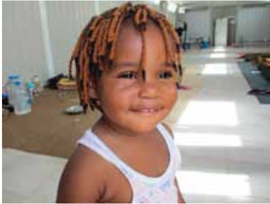
مخيم بورشادة، غاريان

أصل هذه المأساة يعود إلى مارس/آذار ٢٠١١ عندما قررت قوات القذافي المسلحة استخدام بلدة تاورغاء قاعدة للهجمات على مصراتة. نفذت قوات القذافي في تاورغاء هجمات قاتلة ضد مصراتة على مدار ستة أشهر. في ١٠ أغسطس/آب سيطرت كتائب مصراتة على تاورغاء وأمهلت سكانها ٢٤ ساعة ليغادروا البلدة وإلا قُتلوا. زاد من غضب الميليشيات مزاعم بأن سكان تاورغاء منحوا الدعم لقوات القذافي. زعمت الميليشيات أنهم شاركوا في أعمال العنف ضد سكان مصراتة، لا سيما أعمال اغتصاب النساء. تعطش الميليشيات للانتقام استهدف سكان تاورغاء جمعاء، وزاد منه مشاعر عنصرية إزاء الليبيين من أصول تعود إلى أفريقيا جنوب الصحراء. خلف العنف أكثر من ١٠٠ قتيل و٢٠٠ مفقودين و١٣٠٠ محبوسين في مصراتة، حيث وطبقاً لمنظمة العفو الدولية، تعرضوا للتعذيب والمعاملة اللاإنسانية والمهينة. زار الوفد أحد المخيمات، وقد تم تجهيزه في ثكنات موقع إنشائي تديره شركة تركية قرب