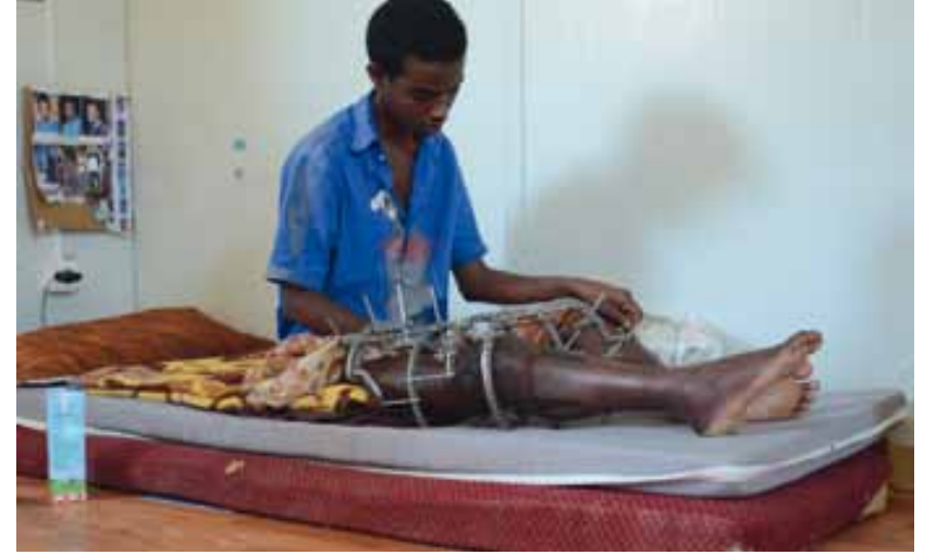
شاب صومالي أصيب خلال اشتباكات في كفرة

تم إنشاء مدرسة صغيرة في المخيم زارها الوفد، لكن التعليم في حده الأدنى بسبب غياب الموارد. ورغم هذه الجهود، من المستحيل تهيئة ظروف مرضية للعائلات، لا سيما لأنهم يعيشون في موقع بناء يمكن إخراجهم منه إذا تم استئناف الإنشاءات، وقبل كل شيء لأنهم يشعرون بالتهديد والوصم بالعار من الليبيين. أظهر السكان للوفد لافتة مكتوب لتسجيل الناخبين، كدليل على إحساسهم بالانتماء والمواطنة وأملهم في أن تصبح ليبيا دولة تحكمها سيادة القانون في ظل نظام قضائي فعال.