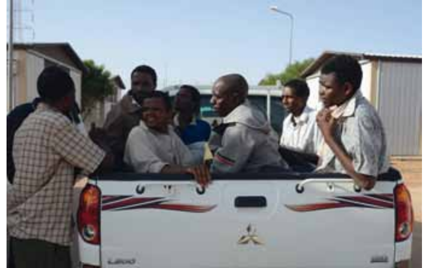
مخيم بورشادة، غاريان

بينما كان الوفد يتحدث مع المحتجزين، مرت سيارة يقودها رجل ليبي وتوقفت أمام باب إحدى السقائف وبدأ في التفاوض مع أحد حراس المخيم. هتف الحارس قائلاً شيئاً ما عبر القضبان الحديدية، ثم فتح البوابة وأخرج ستة مهاجرين صعدهوا على متن الشاحنة بعد الكثير من الصياح والامتناع. كان المشهد كما تم تفسيره للوفد فيما بعد، عبارة عن صاحب عمل ليبي يستقدم عمالاً لزرعته. ابتعد الرجال في السيارة وهم لا يعرفون إلى متى سيعملون، وما إذا كانوا سيحصلون على أجر أم لا، وكم سيتقاضون. سأل الوفد هذه الأسئلة لصاحب العمل الليبي الذي رفض الإجابة. يبدو أن المحبوسين في أقفاص طوال النهار يرون هذه الممارسة – المنظمة بوضوح بطريق التواطؤ من مدير المخيم والحراس – الشر الأقل، حتى رغم أنها من أشكال العمل الجبري.