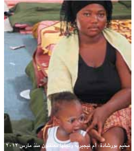
مخيم بورشادة: أم نيجيرية وتحلبها محتجزون منذ مارس ٢٠١٢

يتم الفصل بين الرجال والنساء في المخيمات، وعادة ما لا يُسمح للأزواج والزوجات بالتجمع. رصد الوفد وجود قُصر غير مصحوبين بباليغين في زنازين الرجال والنساء على السواء، وصبية وفتيات صغار بين ١٣ و١٧ عاماً في نفس الزنازين مع الباليغين. كما قابل الوفد سيدات حوامل وأمّهات محتجزات معهن أطفال وأطفال صغار للغاية. أوضاع المعيشة الصعبة في المخيمات لا تلائم الأطفال الصغار على الإطلاق، وهذا يعتبر خرق للمعايير الدولية، بما في ذلك اتفاقية